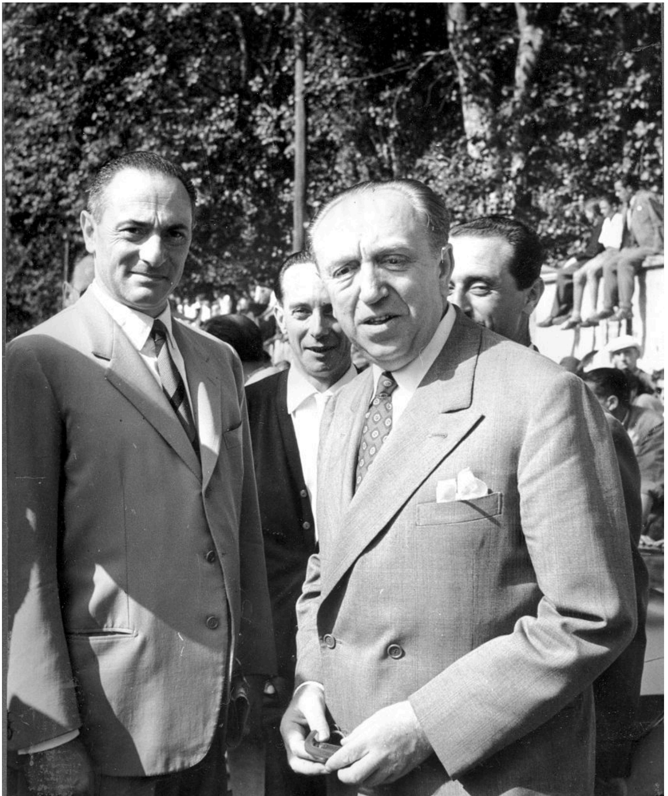
Con il ministro Vanoni

Un sogno deflagrato nel plumbeo cielo di Bascapé' (Pv) insieme al bireattore del 'cane a sei zampe' in fase d'atterraggio sull'aeroporto di Linate quella maledetta sera del 27 ottobre 1962, l'ultima per il Grande Marchigiano. Con lui persero la vita l'inviato di Time-Life, il giornalista americano William McHale e il pilota Irnerio Bertuzzi, asso dei caccia di guerra, medaglia d'oro al valor militare.