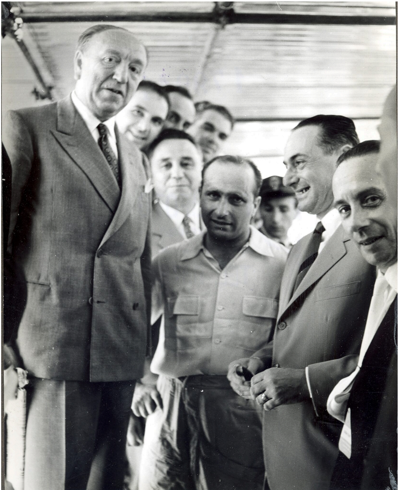
Enrico Mattei con il ministro Vanoni e il pilota Fangio