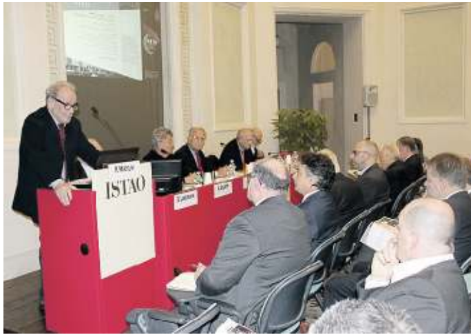
Un momento della celebrazione per i 50 anni dell'Istao

Mezzo secolo di attività pienamente riconosciute dal presidente della Regione Marche, Luca Ceriscioli, che ha mostrato «grande apprezzamento per il lavoro svolto dall'Istituto e dal presidente Marcolini». Il percorso dei festeggiamenti ha visto finora l'alternarsi di seminari, incontri, riunioni di studenti e l'allestimento di una mostra fotografica dedicata a Fuà. E poi il convegno celebrativo, dal titolo «Lo sviluppo delle competenze per il futuro. 1967-2017 il modello Istao», ennesima occasione di riflessione e confronto su temi attuali, strettamente connessi alle Marche e al suo sviluppo socio-economico e, di conseguenza,